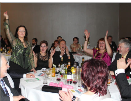
Vítazov v tombole bolo neúrekom