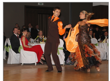
Temperamentné vystúpenie súrodencov Surovcových